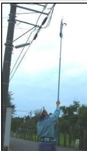
ベルブロック操作時